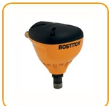
ОБЪЕМНОСТЬ: 12.5 (л) (до 12.5 мПа)